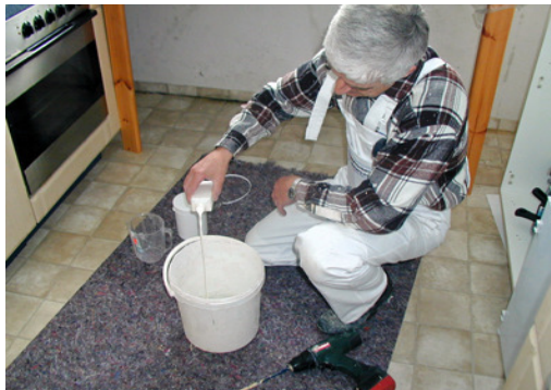
Additiv dazu geben.