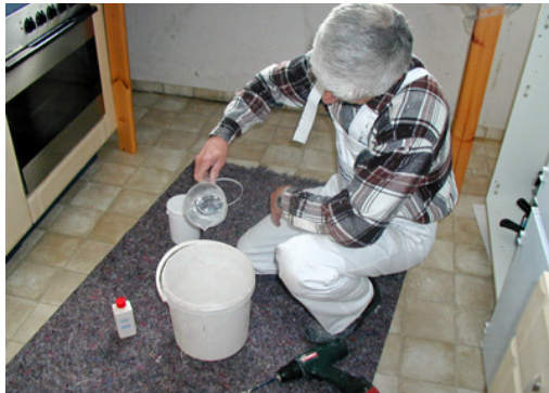
600 ml kaltes Wasser in den Eimer.