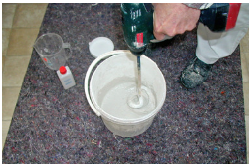
Die Mischung gut umrühren.