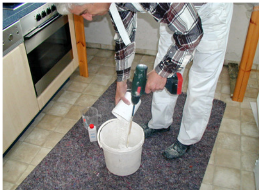
Den Mörtel dazu geben.